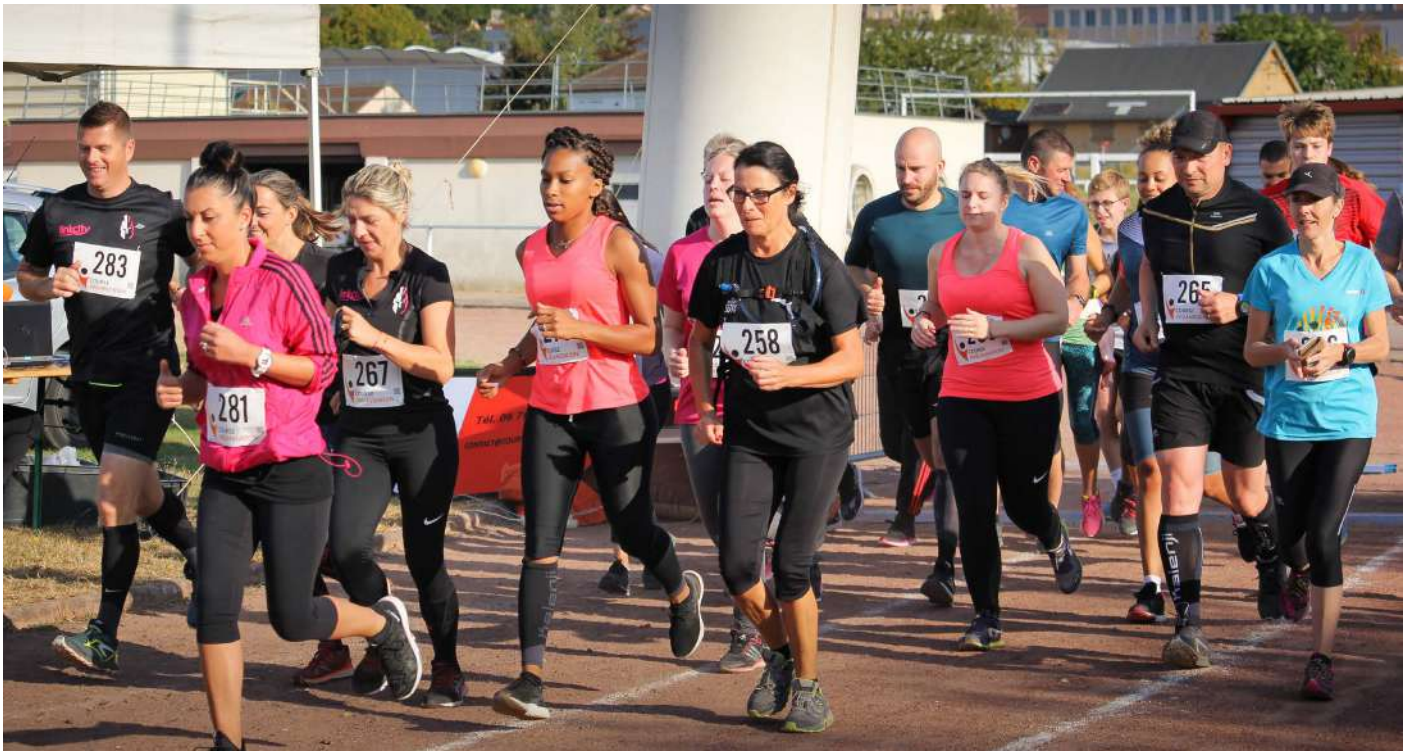
▲ Le départ de la course de 5km du Trail des Loups de 2019