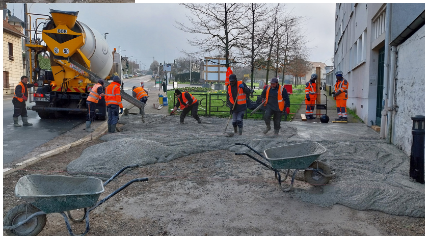
Coulage du béton (mars 2024)