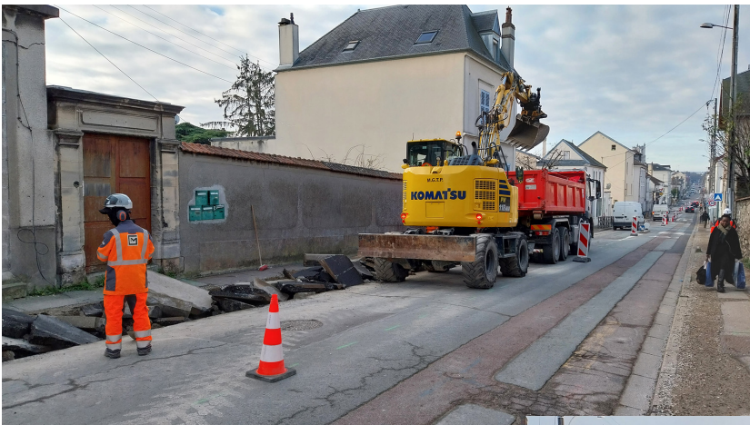
Démolition du trottoir existant au brise-roche (janvier 2024)