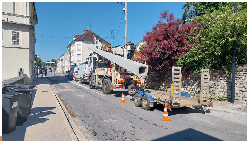
Pose d'un poteau d'arrêt (juin 2024)

À COMPTER DU 2 AOÛT : RÉOUVERTURE DE LA RUE NATIONALE ET DES RUES ADJACENTES