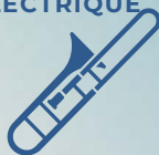
TROMBONE / TUBA