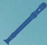
FLÛTE À BEC