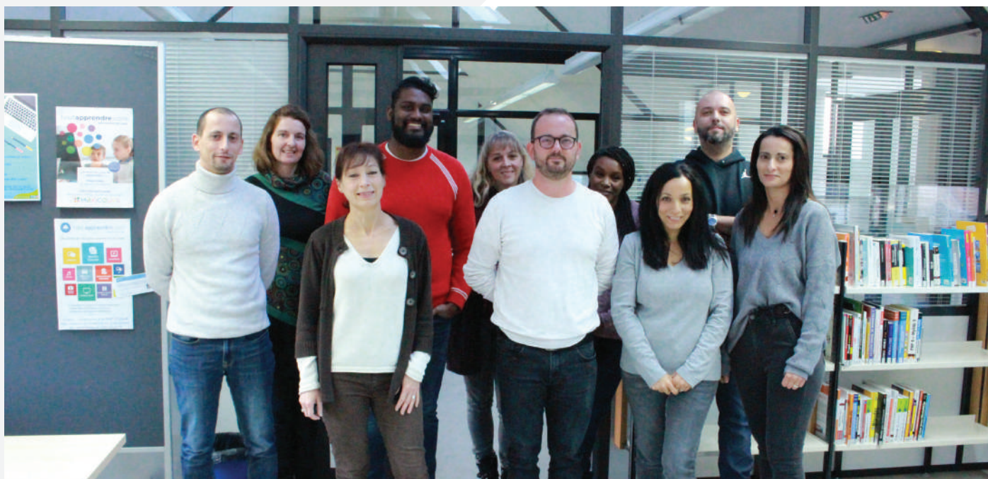
▲ La médiathèque de Limay, ce sont 11 agents qui vous accueillent et vous accompagnent, dont 3 dédiés à la médiation numérique.