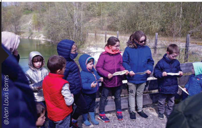
@Jean Louis Barres

LES CURIEUX ÉTAIENT NOMBREUX POUR PARTIR EN BALADE ET À LA DÉCOUVERTE DES GRENOUILLES, TRITONS ET AUTRES INSECTES D'EAU DE LA RÉSERVE NATURELLE. ADULTES ET ENFANTS ONT APPRÉCIÉ CETTE INITIATIVE ORGANISÉE DANS LE CADRE DE L'ÉVÈNEMENT NATIONAL « FRÉQUENCE GRENOUILLE ».