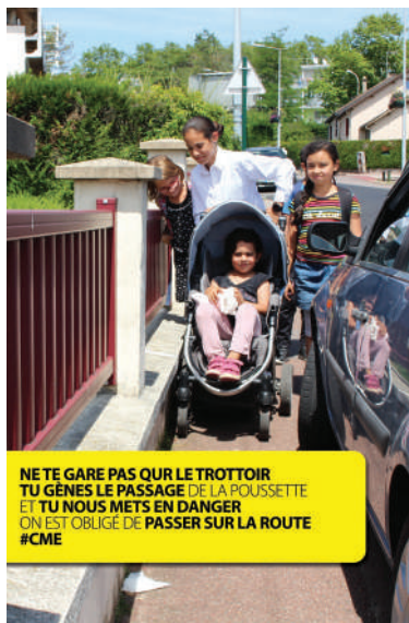
▲ Exposition réalisée par le CME en 2018 pour la prévention routière auprès des Limayens.

Mettant à profit une exposition réalisée par le précédent CME, les jeunes conseillers sont allés au-devant des élèves de la ville et de leurs parents, à l'heure de la sortie des classes, pour inviter les automobilistes à plus de civisme. Le stationnement anarchique, a fortiori devant les établissements scolaires, gêne fortement la circulation et met en danger la vie des écoliers : écoutons nos enfants et respectons le Code de la route !