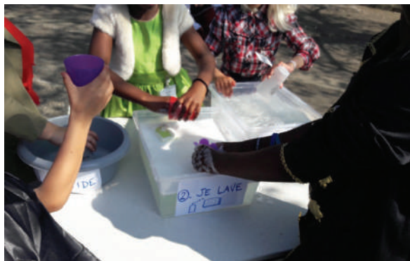
▲ Éco-délégués et élèves volontaires font la vaisselle dans la bonne humeur lors du Carnaval, on évite ainsi les gobelets jetables.

Agir pour l'environnement et former les éco-citoyens de demain, tels sont les objectifs visés par l'équipe enseignante de l'école élémentaire Ferdinand Buisson.