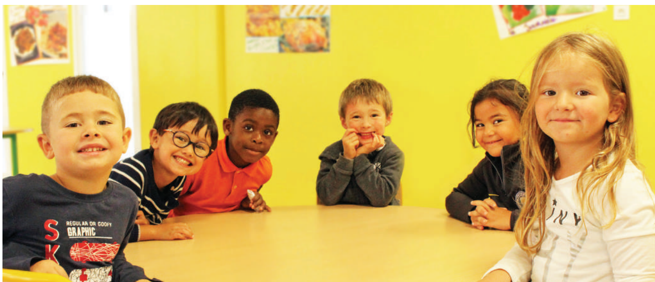
Après la classe, les enfants attendent le goûter au réfectoire

« Toutes les recherches ont prouvé depuis longtemps que le matin est le moment de la journée où « la clarté mentale » est la meilleure pour l'ensemble des apprentissages, pour tous les enfants. D'où l'importance d'avoir au moins 5 journées et demi , mais également, et la preuve en est faite depuis 4 ans que cela existe dans les communes que j'ai accompagnées, qu'elle soit plus longues... »