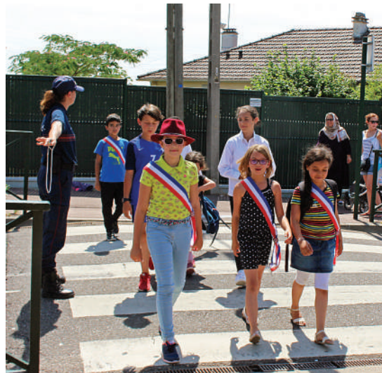
La sécurité est l'affaire de tous

Les jeunes élus souhaitent sensibiliser l'ensemble de la population sur l'état de certains de nos trottoirs.