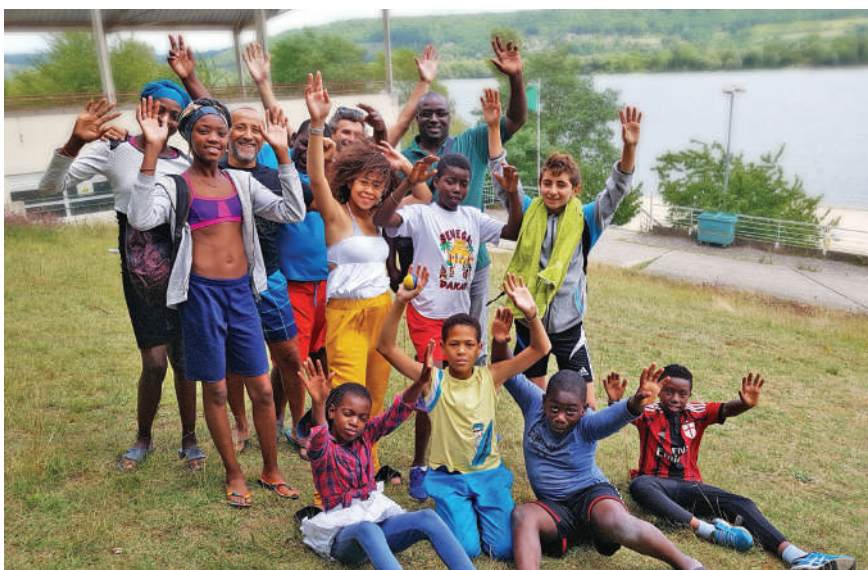
Le plaisir d'être en vacances !

« Les jeunes ont adhéré à la démarche et ont été réceptifs » se félicite Bouzid, l'un des éducateurs.