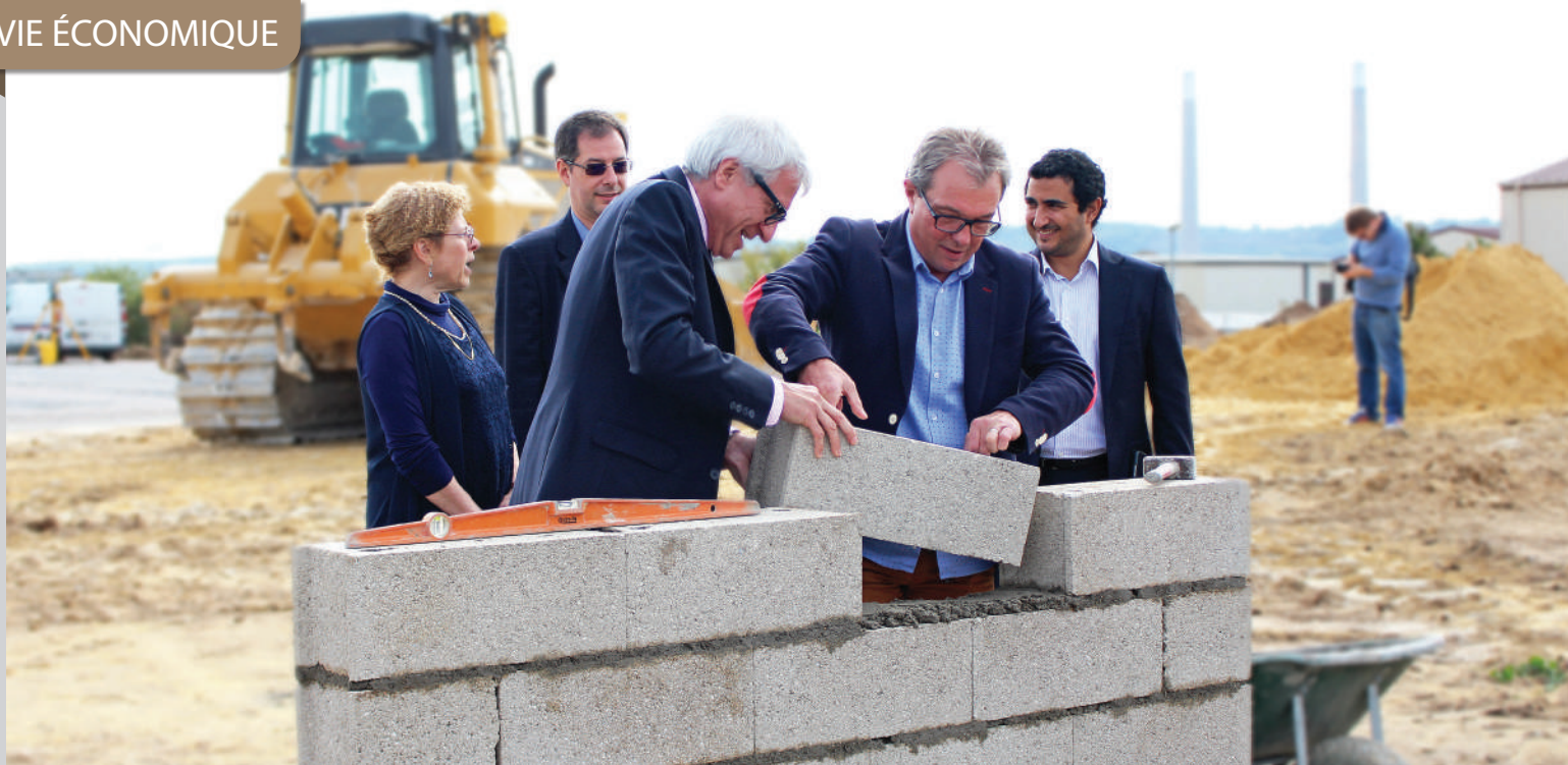
La pose de la première pierre d'un projet de développement économique