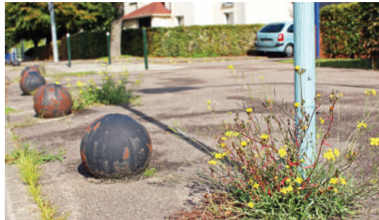
Une impression d'insalubrité qui ne trompe pas

D e la broussaille à même le sol, les mauvaises herbes dans les caniveaux et sur les trottoirs, des encombrants au devant des pavillons. Une impression d'insalubrité qui ne trompe pas. Plusieurs fois interpellés par les Limayens, les élus se disent conscients des manques liés à la gestion de la voirie, des missions désormais assurées par les services de la Communauté urbaine.