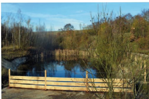
Aménagements d'accueil et de sécurité d'une mare appréciée des batraciens et des libellules montrant une roche datant de l'époque des dinosaures (80 millions d'années)