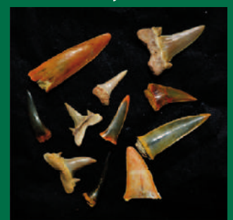
Dents de requins fossiles préservées dans les roches de la réserve naturelle, collection M.-B. Renaud