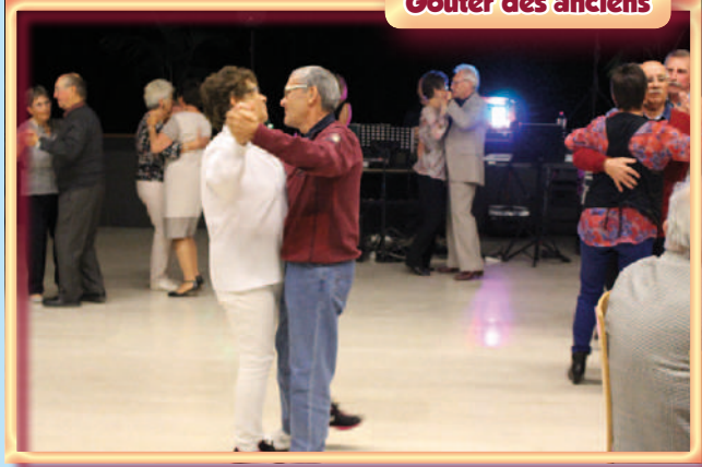
Goûter des anciens