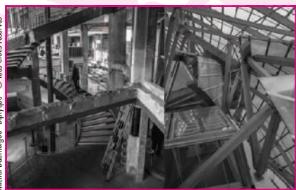
Michel Drummeque - D'Inryque - © tous droits réservés

Mais il est évident qu'accrocher des photos sur le même mur ne suffit pas à créer une exposition et il était nécessaire de proposer une démarche plus originale, plus cohérente.