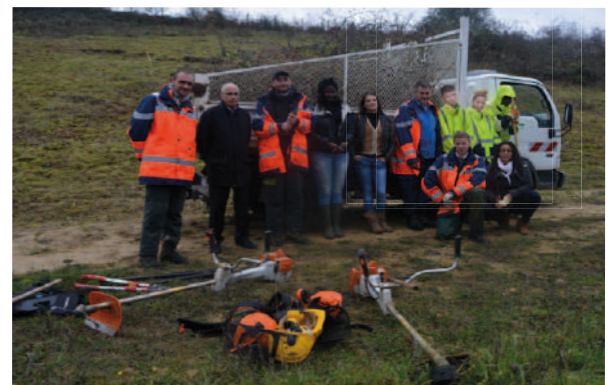
Travaux d'automne avec le service espaces naturels de la ville et l'APSY