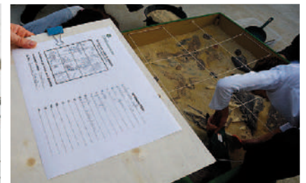
Atelier "Deviens paléontologue!" avec les écoles primaires de la ville et le collège A. Thierry (article relatant l'expérience des élèves de troisième disponible sur le site de l'établissement: http://www.clg-thierry-limay.ac-versailles.fr/spip.php?article959 )