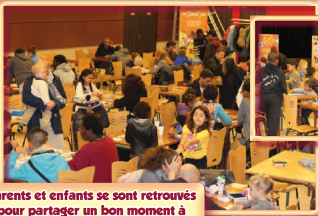
Parents et enfants se sont retrouvés pour partager un bon moment à l'occasion de la "faites du jeu"