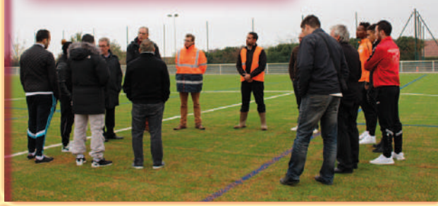
Visite du nouveau terrain synthétique aux Fosses Rouges