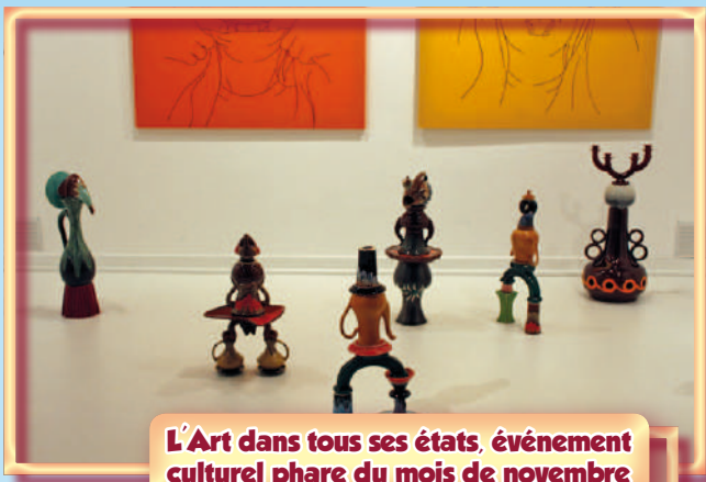
L'Art dans tous ses états, événement culturel phare du mois de novembre