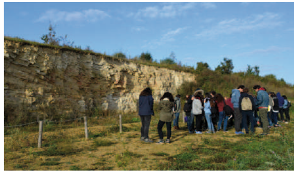
Les élèves de classe prépa. devant le paléochenal

1,78 kilomètres de fil de fer ont été utilisés cet automne pour réparer un tronçon de la clôture périphérique de la réserve naturelle et réaliser les aménagements de sécurité autour de la mare à craie du Campanien.