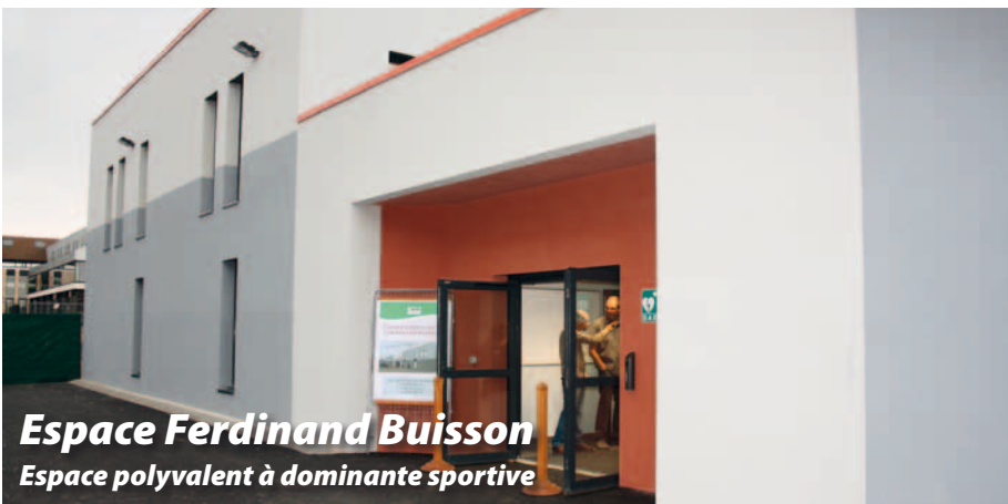
Espace Ferdinand Buisson Espace polyvalent à dominante sportive

2 photos, un certificat médical, justificatif de domicile