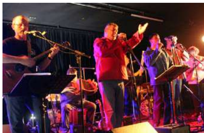
Les Z'embruns d'Comptoirs ont privilégié le répertoire des chansons traditionnelles, alliant chansons de marins et créations originales.