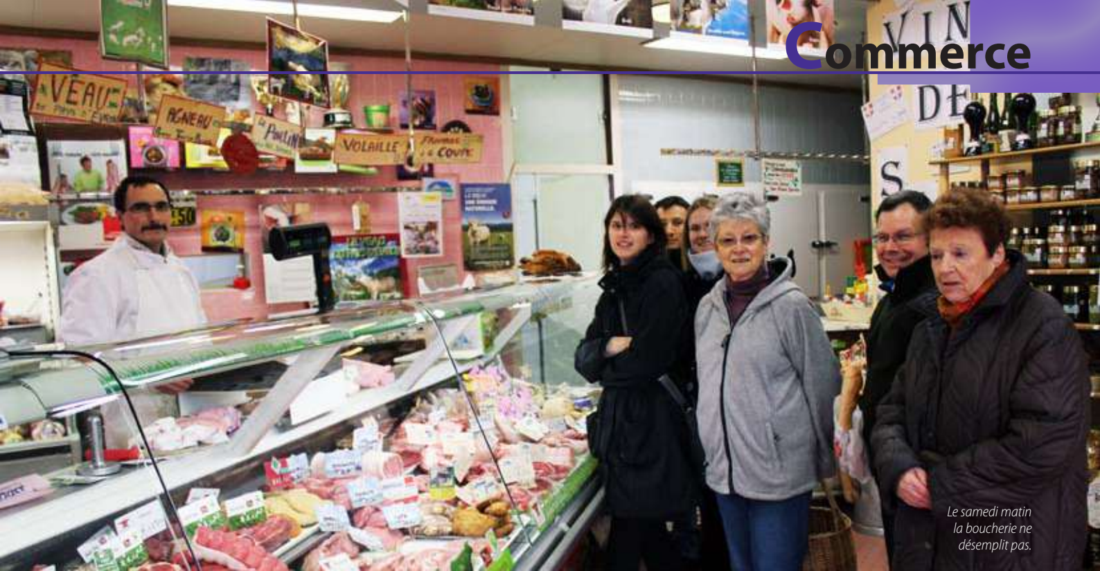
Le samedi matin la boucherie ne désempt pas.

participe à de nombreux concours professionnels nationaux dont il gagne souvent le premier prix. « Les concours professionnels nationaux que j'ai gagnés (pâté breton, boudin blanc...) et mes spécialités comme la Limayenne m'ont fait connaître... ».