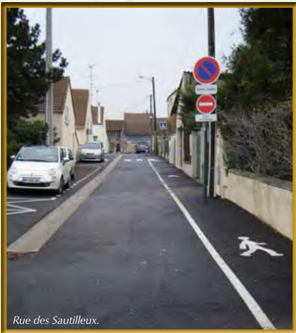
Rue des Sautilleux.