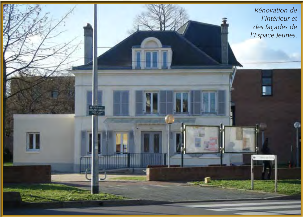
Rénovation de l'intérieur et des façades de l'Espace Jeunes.