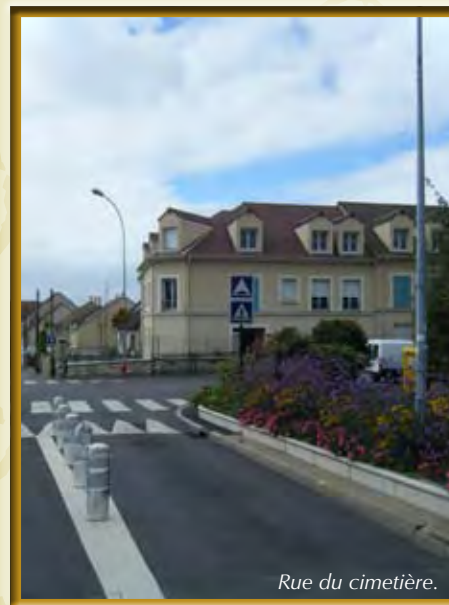
Rue du cimetière.