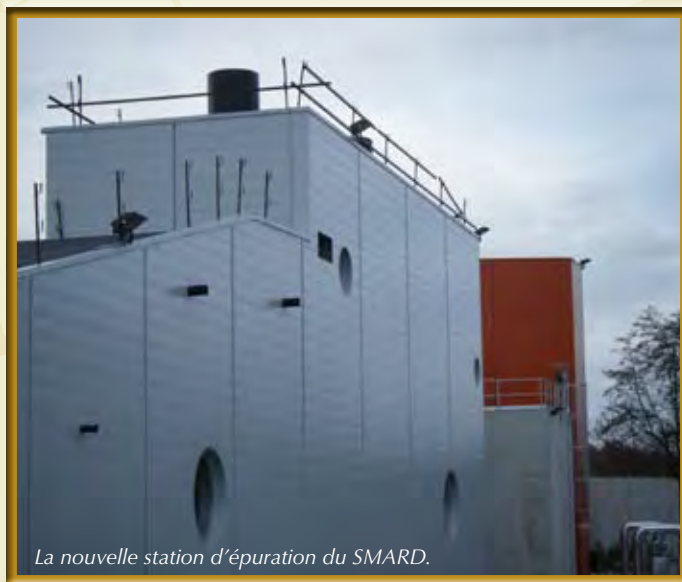
La nouvelle station d'épuration du SMARD.