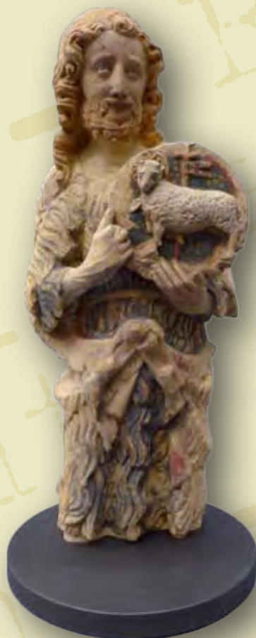
Statue de Saint-Jean Baptiste.