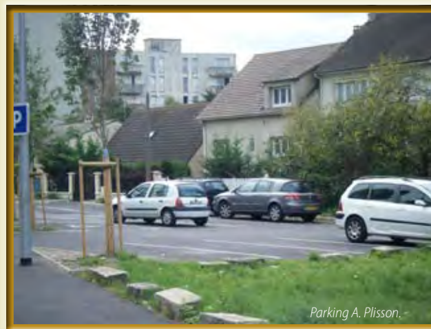
Parking A. Plisson.