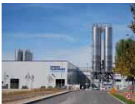
france plastique recyclage.