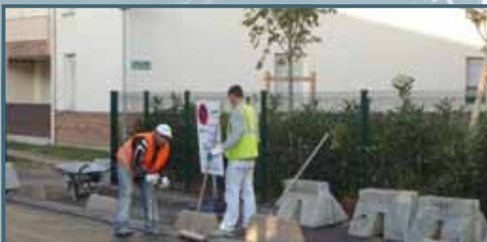
Pose de bornes anti-stationnement rue Maximilien Robespierre.