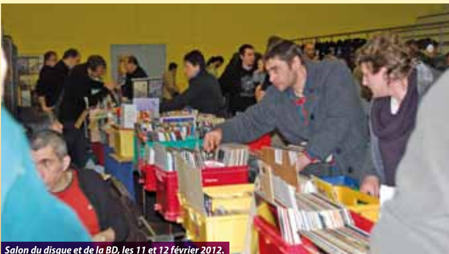
Salon du disque et de la BD, les 11 et 12 février 2012.

Carnaval sur le thème du « Cirque et Moyen Age ».