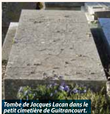
Tombe de Jacques Lacan dans le petit cimetière de Guitrancourt.

Guitrancourt est une commune de 631 habitants. Les habitants sont appelés les Guitrancourtois. Parmi les Guitrancourtois, il y en eut un de célèbre: Jacques Lacan, dont en 2011 on commémorait le 30e anniversaire de sa mort. Jacques Lacan repose dans le petit cimetière de Guitrancourt. L'homme est à fois célèbre et peu connu du grand public. N'empêche, Jacques Lacan a magistralement développé et approfondi la pensée Sigmund Freud, le père fondateur de la psychanalyse. Pour certains, Lacan était un maître, pour d'autres, un gourou. C'était