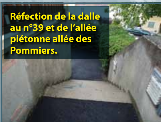
Réfection de la dalle au n°39 et de l'allée piétonne allée des Pommiers.