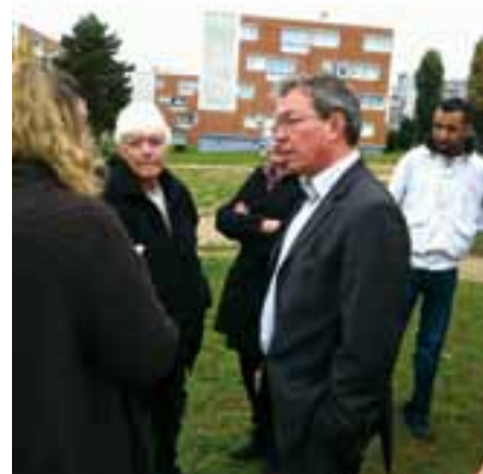
Rencontre avec les habitants de la Chasse le 5 novembre.

Après avoir rencontré les habitants, le Maire et les élus ont rencontré Logirep le 21 novembre en Mairie. Les discussions ont porté sur la réhabilitation des espaces extérieurs, la sécurisation des entrées, le traitement des locaux à poubelles... Les élus ont bien entendu exprimé l'ensemble des problèmes signalés par les locataires. Il s'agit maintenant de passer aux choses concrètes. Pour ce faire, d'autres réunions ont été programmées.