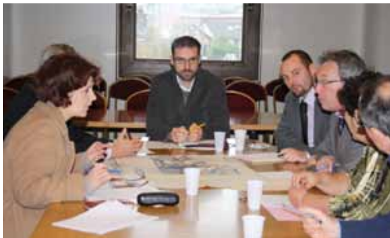
Réunion en Mairie avec les responsables de l'IRP suite à la rencontre des élus et des habitants des Basses-Meunières.