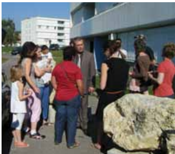
Rencontre avec des habitants des Basses-Meunières le 1 er octobre.