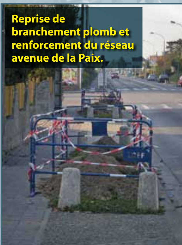
Reprise de branchement plomb et renforcement du réseau avenue de la Paix.