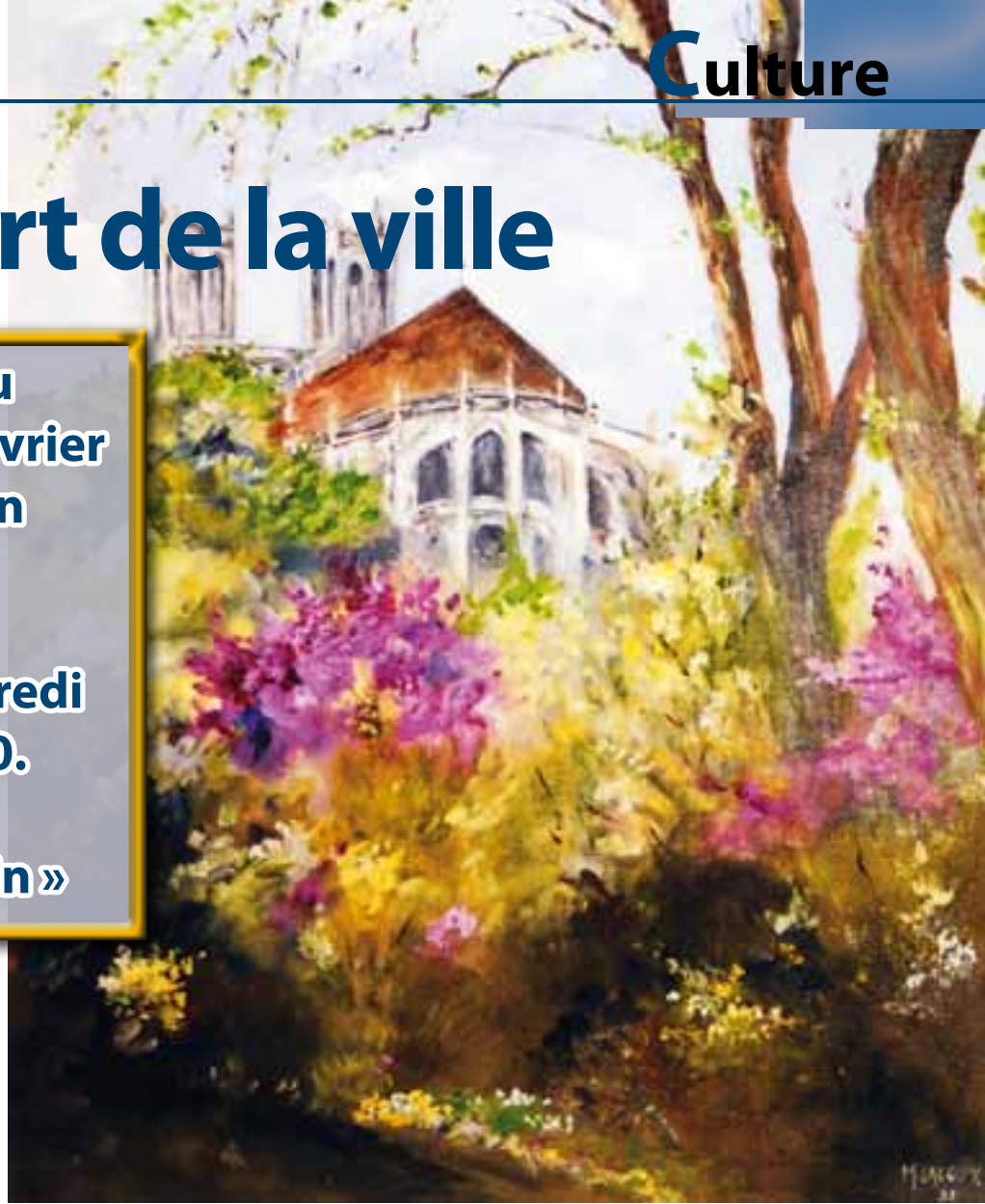
Heidi Wood, « Wheelers Hill 1 (Votre maison ici) », 2012, tirage jet d'encre

Comme le veut la tradition, le Salon d'Art de la Ville se clôt par la remise de récompenses. Un jury composé de plusieurs personnalités désigne les meilleures œuvres et attribue un prix à leurs auteurs. La très grande majorité des œuvres présentées lors de ce Salon sont le fait d'amateurs et néanmoins artistes.