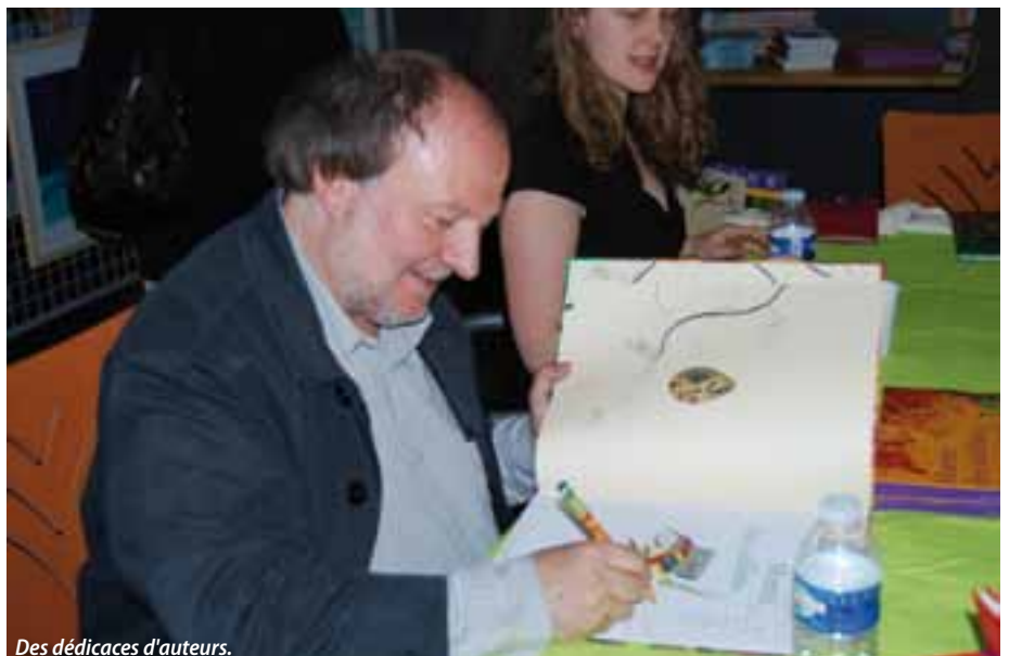
Des dédicaces d'auteurs.