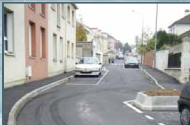
La rue du Cimetière est désormais achevée.