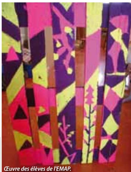
Œuvre des élèves de l'EMAP.