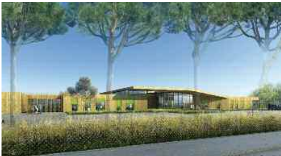
Projet de construction du Foyer d'Accueil Médicalisé

Le Syndicat Intercommunal des Établissements pour Handicapés du Val de Seine (SIEHVDS) est l'un des plus importants en France. Chaque jour, dans les Yvelines, dans la douzaine d'établissements qu'il a construits, il accueille 800 handicapés et emploie 345 agents.