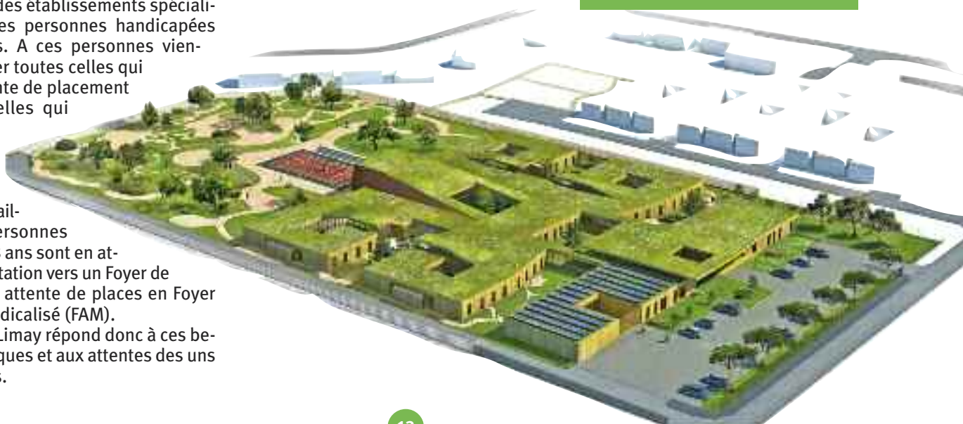
Projet de construction du Foyer d'Accueil Médicalisé