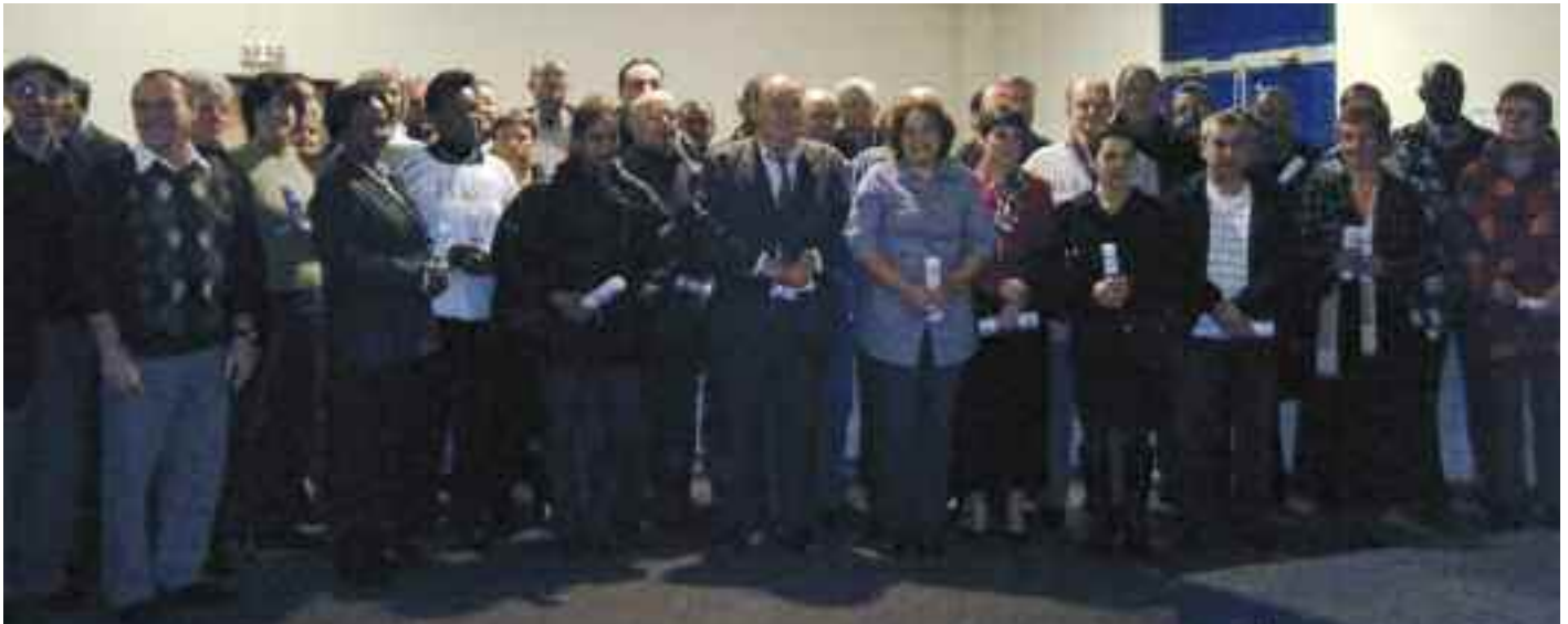
Les médaillés du travail 2009

entre les femmes et les hommes qui n'a que trop duré. Les femmes gagnent 27 % de moins que les hommes. En 2007, le gouvernement avait promis l'égalité professionnelle et salariale entre les femmes et les hommes en 2009. Mais comme d'autres promesses, rien n'a été fait pour réduire ces inégalités qui se répercuteront au moment de la retraite des femmes.